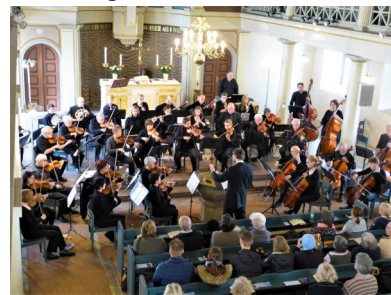
Konzert der SINFONIETTA WESERBERGLAND in der Petri-Pauli-Kirche in Bad Münde am 05.05.2019