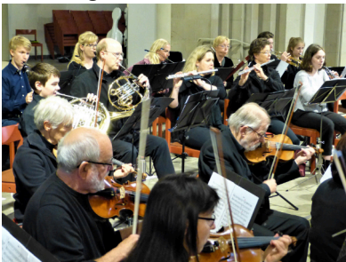
Konzert der SINFONIETTA WESERBERGLAND in der Marktkirche St. Nicolai in Hameln am 04.05.2019